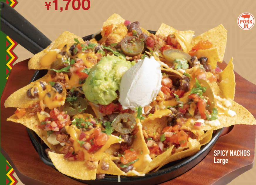
SPICY NACHOS Large