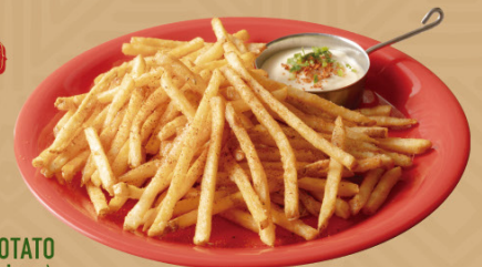
CRISPY CRUNCH POTATO (Spicy mexican)