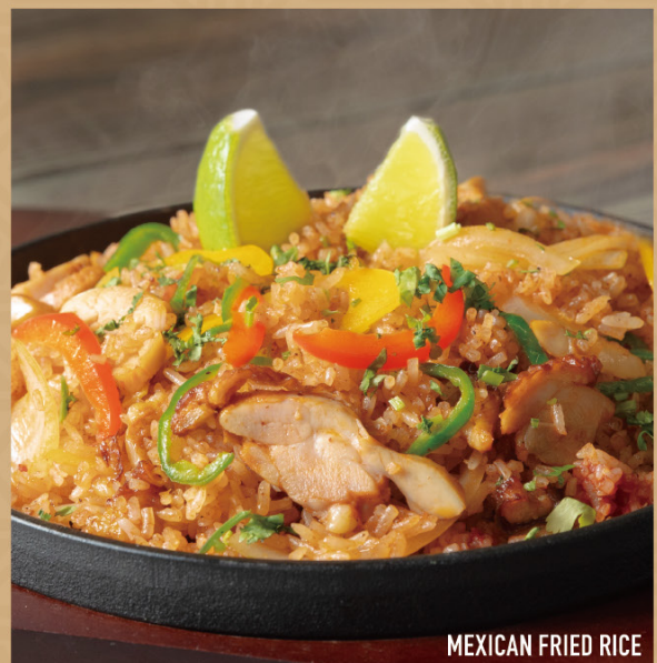
MEXICAN FRIED RICE

ピリ辛のチリチキンと新鮮野菜を炒め、メキシカンスパイスで香り高く味付け。スパイシーでありながらコク深く、ライムを搾ればさらに爽やかな酸味が加わり、全体の味わいを引き立てます。