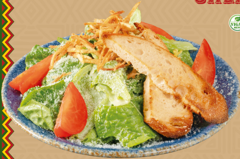
MEXICAN CAESAR SALAD