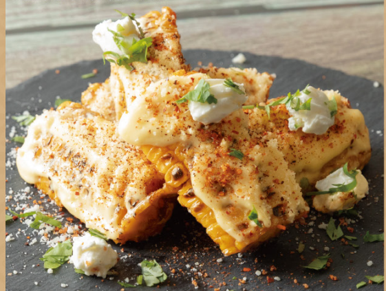
MEXICAN SPICY CORN RIBS