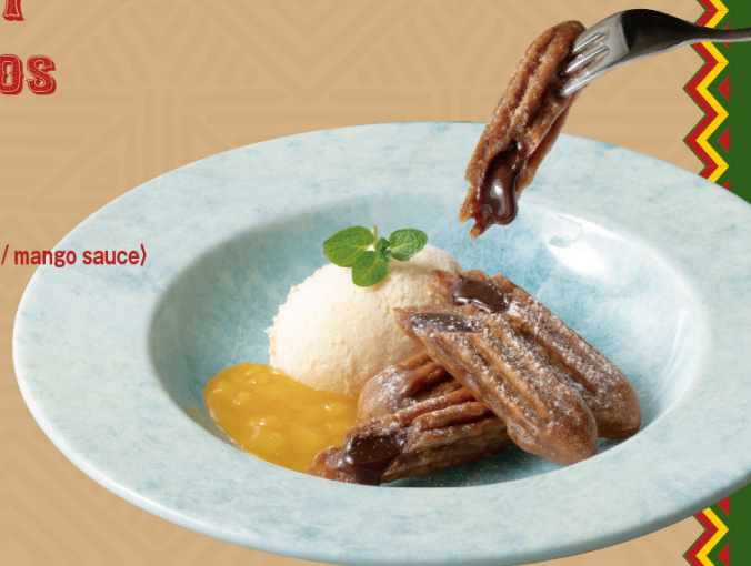
CHOCOLATE CHURROS & ICE CREAM (Mango sauce)